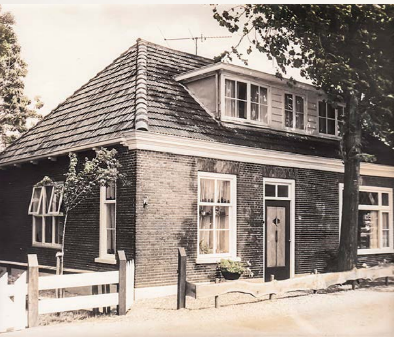
Het huis aan de Leidseweg 22 in Oud Ade met de vergrote dakkapel.