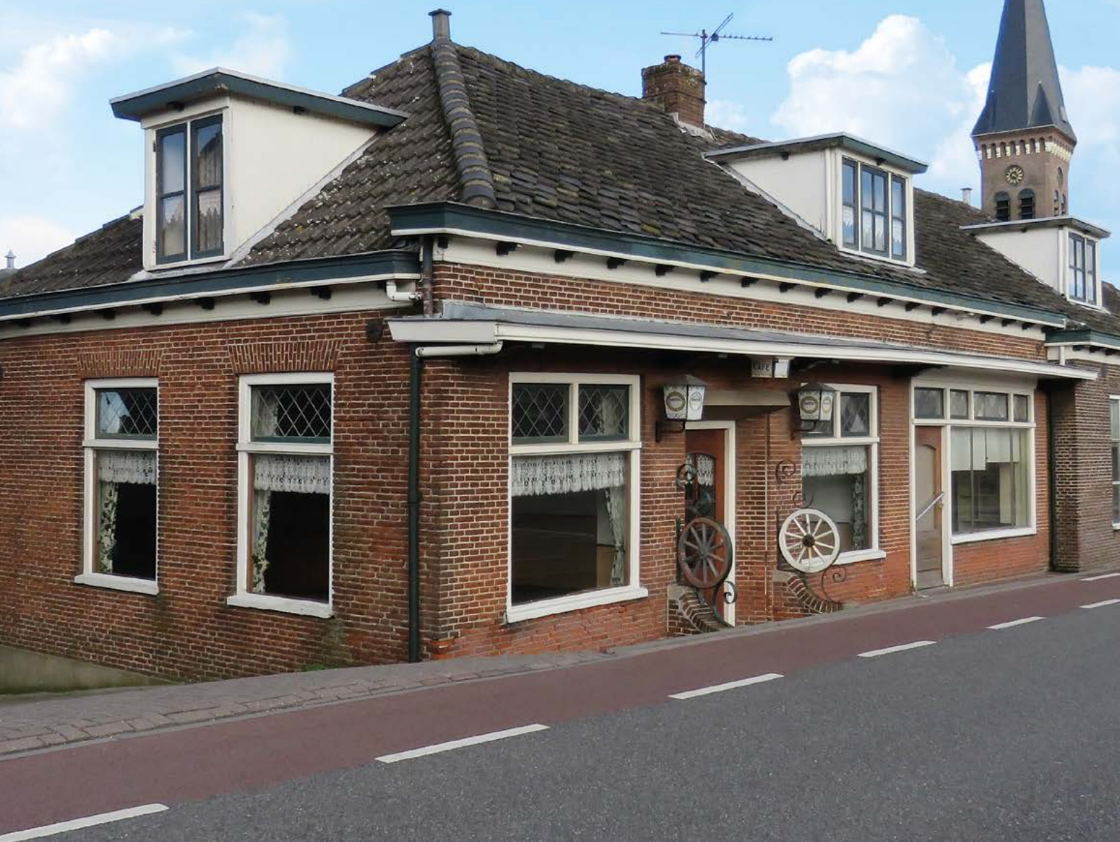
Voormalig Café 't Lageland, Oud Ade

----- Hoe was het vroeger om kind te zijn