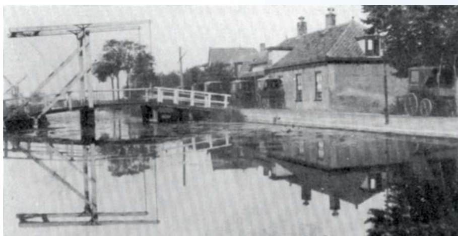
Oud Ade tijdens de hoogmis. Koetsjes (of kapwagens zoals ze ook genoemd werden) waarmee de boeren die verder weg wonen naar de kerk zijn gekomen, staan geparkeerd vóór en naast het café. De paarden staan beneden in de uitspanning. Een kapwagen was een praktisch vervoermiddel in die tijd maar ook een prestige-object. In de bloeitijd stonden er 's zondags wel zo'n tien kapwagens bij het café (ca. 1940-1945).

De bus uit Leiden stopte in die tijd pal voor het café. Als het regende konden