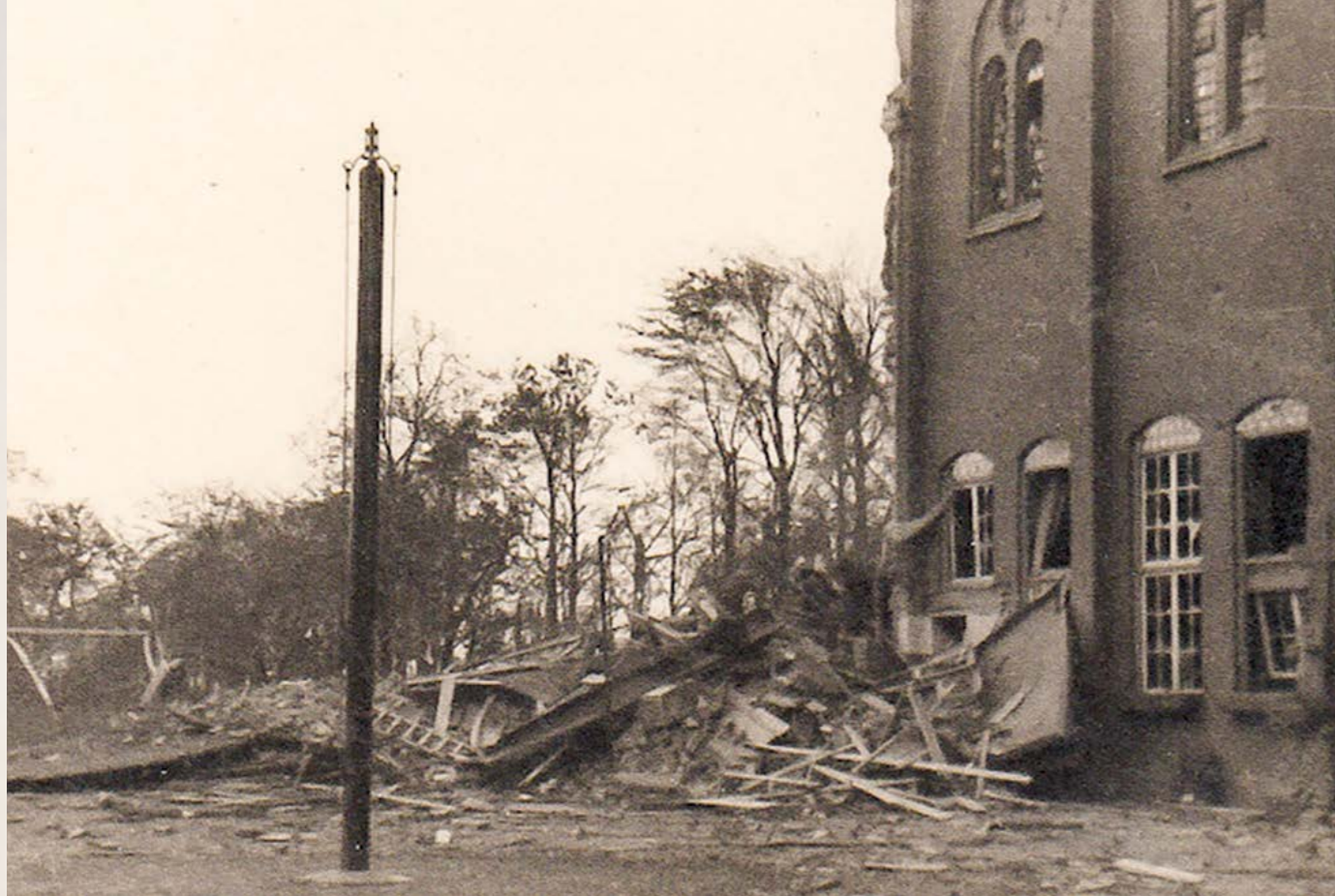
Bij daglicht bleek de schade aan het seminarie pas goed zichtbaar.

Meteen bij de uitgang van de kelder stonden vijf kruizen met een helm erop van gesneuveld Duitsers. Er lag veel dood vee verspreid over het land. Het hele dorp was vernield en in puin. Hier en daar lag nog een hoop antraciet te gloeien. Het was zo deprimerend, dat we weer graag de kelder in gingen. We mochten ook even naar ons oude gebouw. Het dak was eraf, maar mijn kist stond nog op dezelfde plaats (ik heb hem nu nog).