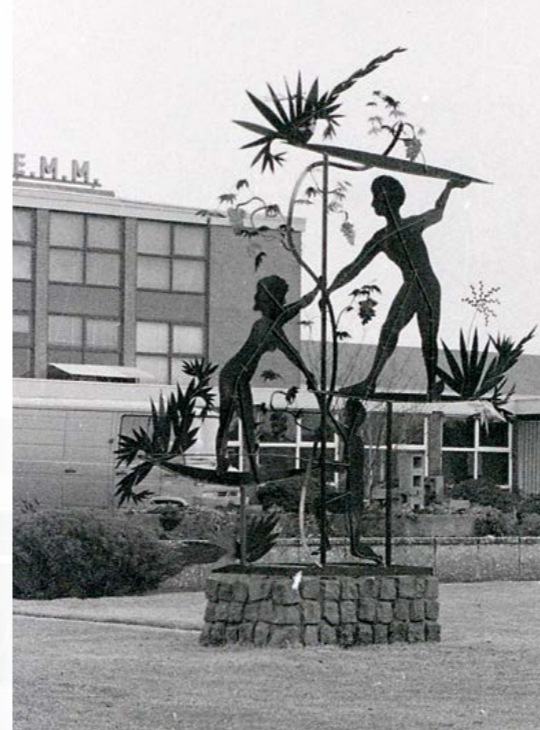
Het kunstwerk dat voor de veiling stond werd gemaakt door Joop Oomen. Het bestaat helaas niet meer.