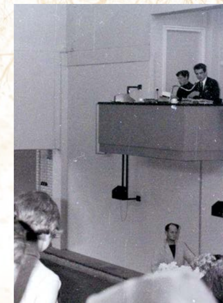
Twee veilingmeesters op het balkon.

Mijn vader veilde dus bloemen en planten van vooral Veense kwekers. De veiling ontving provisie van de kwekers over de geveilde producten. Als de kwekers niet te veel provisie wilden betalen, moesten ze lid zijn van de veiling en dat mocht maar bij één veilingcoöperatie. Voor de veiling was het dus belangrijk dat er veel kwekers lid waren. In de directe omgeving waren nog twee veilingen, in Aalsmeer en in Rijnsburg, en alle drie de veilingen wilden de grootste worden. Er was dus een behoorlijke concurrentiestrijd tussen de veilingen. Wilde je als kweker overstappen naar een andere veiling, dan moest je een boete betalen. Kopers daarentegen konden wel bij meerdere veilingen terecht, maar ook zij moesten betalingen doen over de gekochte bloemen, zoals de Heffing Productschap voor Sierteeltgewassen (PVS). De kopers kwamen over het algemeen uit Amsterdam en waren vaak gehaaide mensen. Dat merkte mijn vader ook. Zo gaven de kopers soms