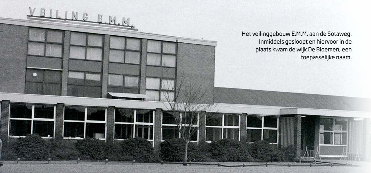
Het veilinggebouw E.M.M. aan de Sotaweg. Inmiddels gesloopt en hiervoor in de plaats kwam de wijk De Bloemen, een toepasselijke naam.