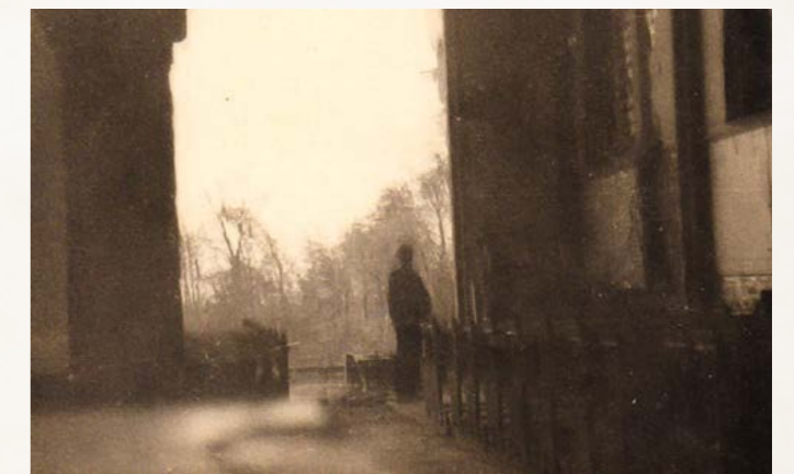
Een pater inspecteert de schade door de oorlogshandelingen aan de kapel van het kleinseminarie.

Het bevrijdingsleger kwam vanuit het zuiden oprukken. Om bij het Hollandsch Diep te komen, moesten zij eerst nog het kleine riviertje de Mark oversteken. Het klooster, de kerk en het seminarie vormden een enorm complex, hoog met dikke muren. Bovendien was er een nog hoger gedeelte: de Olympus. De Duitsers hadden het strategische punt goed in de gaten en stelden hun geschut op achter deze gebouwen. De Olympus was een uitkijkpunt voor de Duitsers en zodra de bevrijders een bruggenhoofd probeerden te maken over de Mark, gaf de observatiepost dat meteen door aan het geschut, waarop het bruggenhoofd weer vernietigd werd. De bevrijders dachten: "Dan maar die gebouwen wegvagen." De gebouwen kregen heel veel voltreffers te verwerken, maar er was nog maar weinig weg. Ik heb nog steeds een granaathuls uit die tijd, waar ik een asbak van heb laten maken. Daarop werd besloten om de gebouwen te bombarderen met vliegtuigen. We hebben werkelijk doodsbang uitgestaan, maar gelukkig kwamen alle bommen op het voetbalveld terecht, precies naast het seminarie. Ieder ogenblik dacht je "dit is het einde", maar er gebeurde niets.