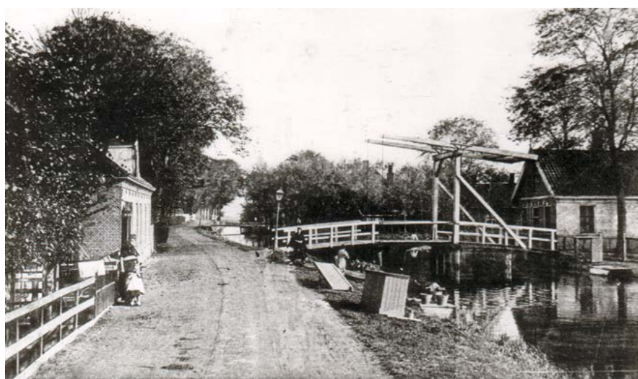
Een oude Ansichtkaart van het dorp Oud Ade. In de verte links (toen nog) Café 'Klein Rustoord'.