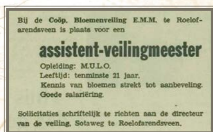
De advertentie voor een assistent-veilingmeester.