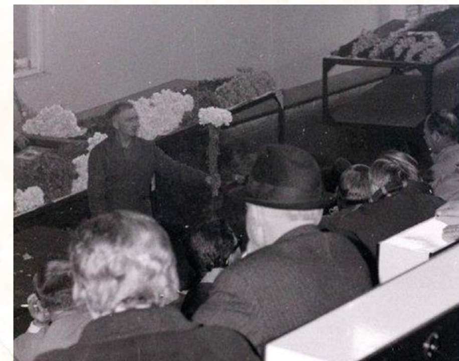
Een 'opsteker' toont een bos uit de partij bloemen aan de kopers.

Natuurlijk kwam het ook voor dat producten niet verkocht werden. Dan 'draaiden' de bloemen of planten 'door' en moesten uiteindelijk vernietigd worden. Dat was natuurlijk vervelend voor de kwekers, want die hadden hierdoor geen inkomsten. Maar het kon ook gebeuren dat de producten na het doordraaien alsnog verkocht werden. Zo werd er een keer rond kerst een partij onverzorgde Callicarpa , decoratie-